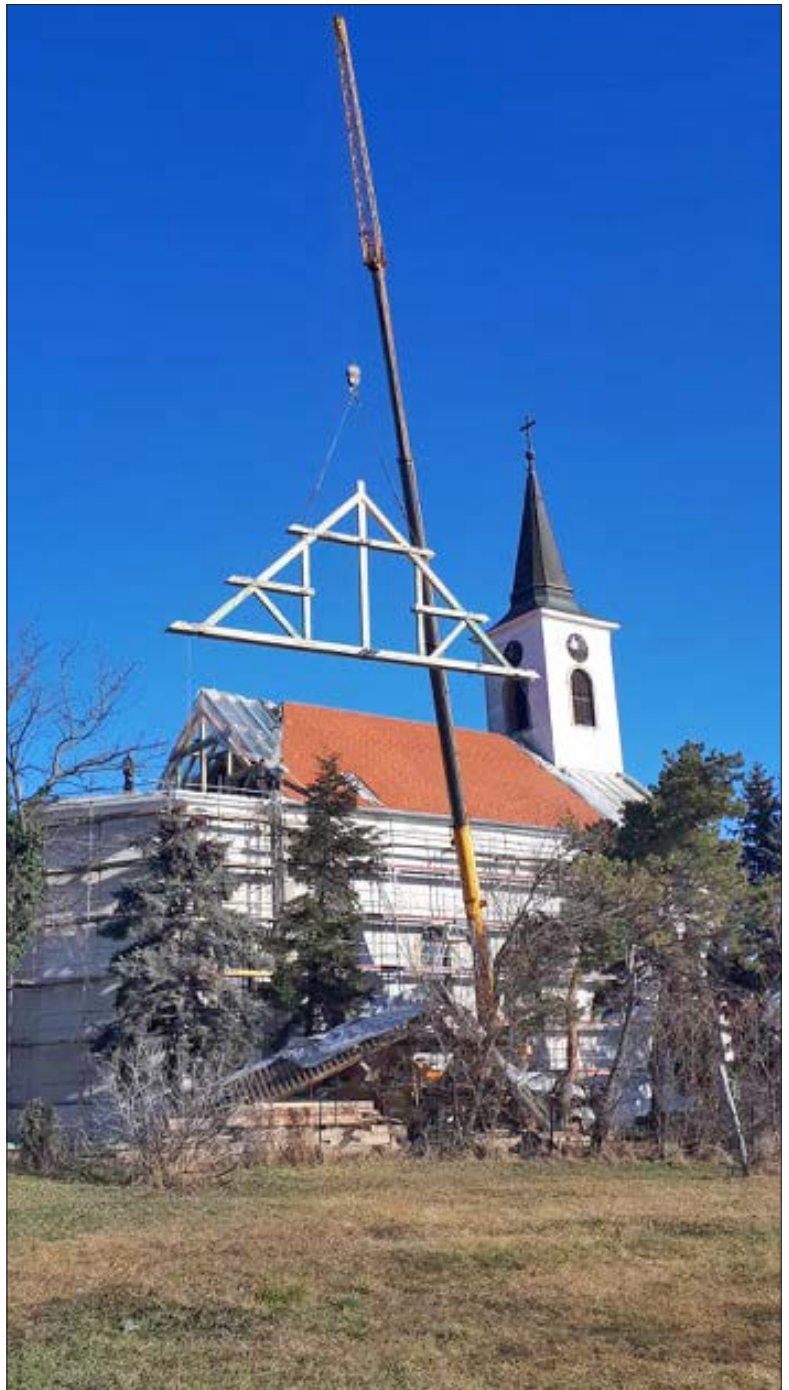
Utolsó fázisához érkezett a püspöklaki templom felújítása